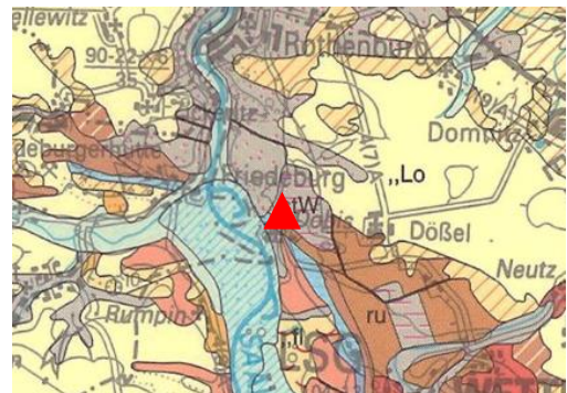
Geologische Übersichtskarte (GÜK 200) © BGR Hannover und LAGB Sachsen-Anhalt